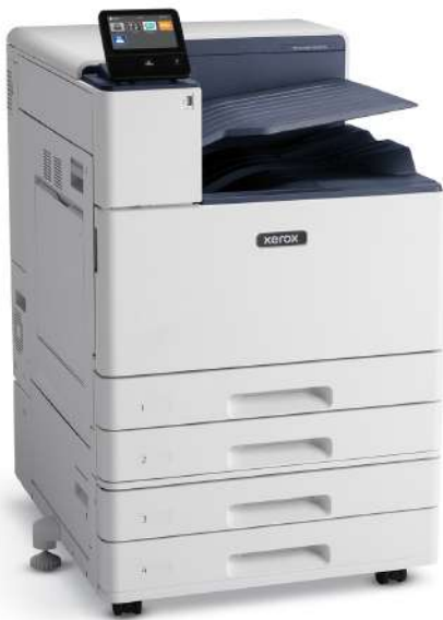
VersaLink® C8000W plus module met 2 laden