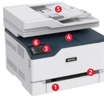
Xerox® C235 multifunctionele kleurenprinter 6 USB-poort aan de voorzijde