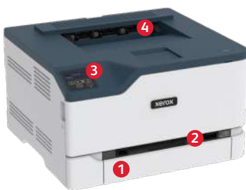
Xerox® C230 kleurenprinter