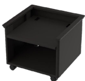
Support d'imprimante réglable