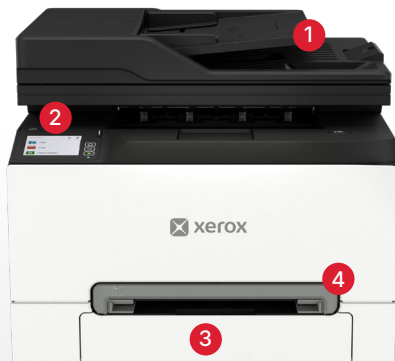
Imprimante multifonction Xerox® C245